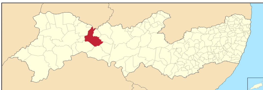
Figura 1. Mapa de localização do município de Salgueiro/PE, área foco da pesquisa.